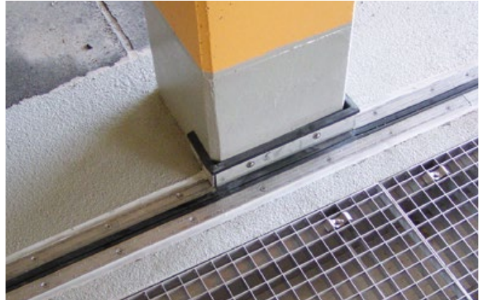
Parkhaus Annaberg – FP 90