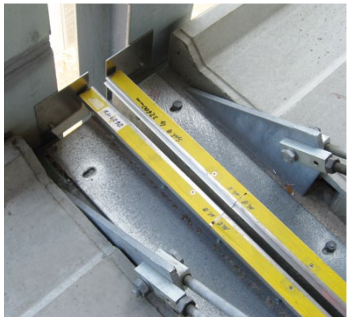
Parkhaus Weiterstadt – FP 90