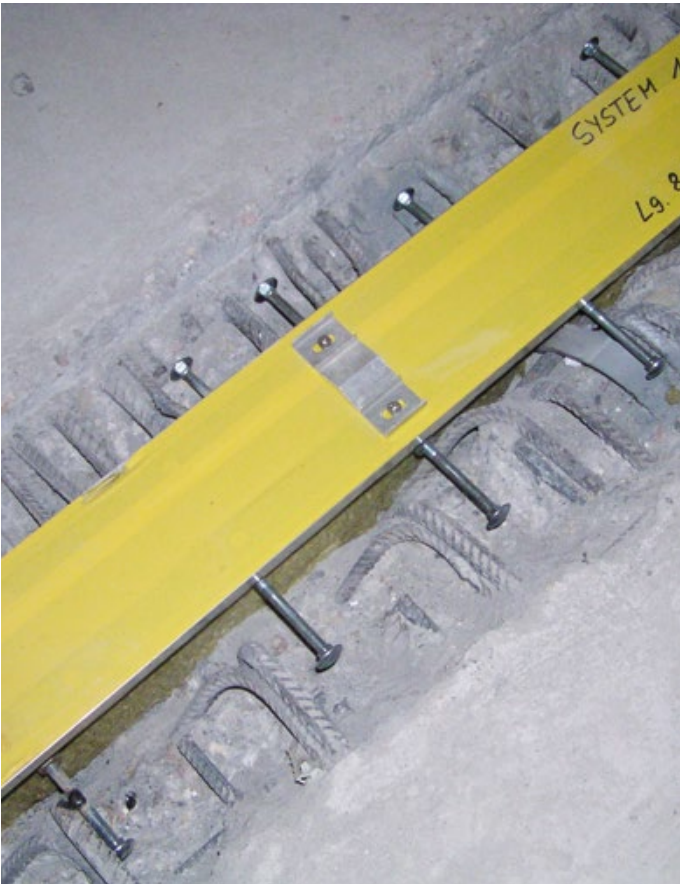
BBI Berlin – FP 90 BNI