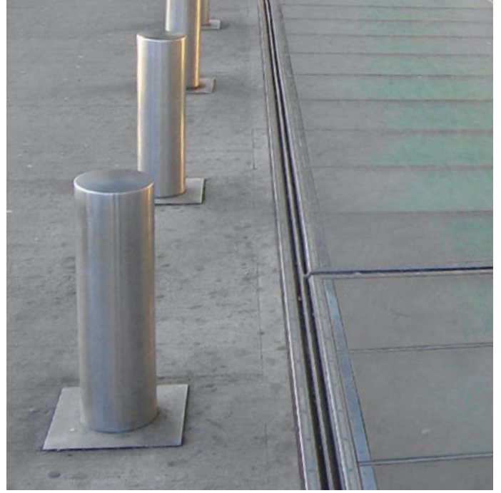
Flughafen Köln/Bonn – FP 90