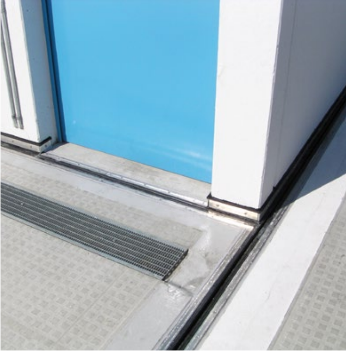
Parkhaus Berlin, Beusselstraße