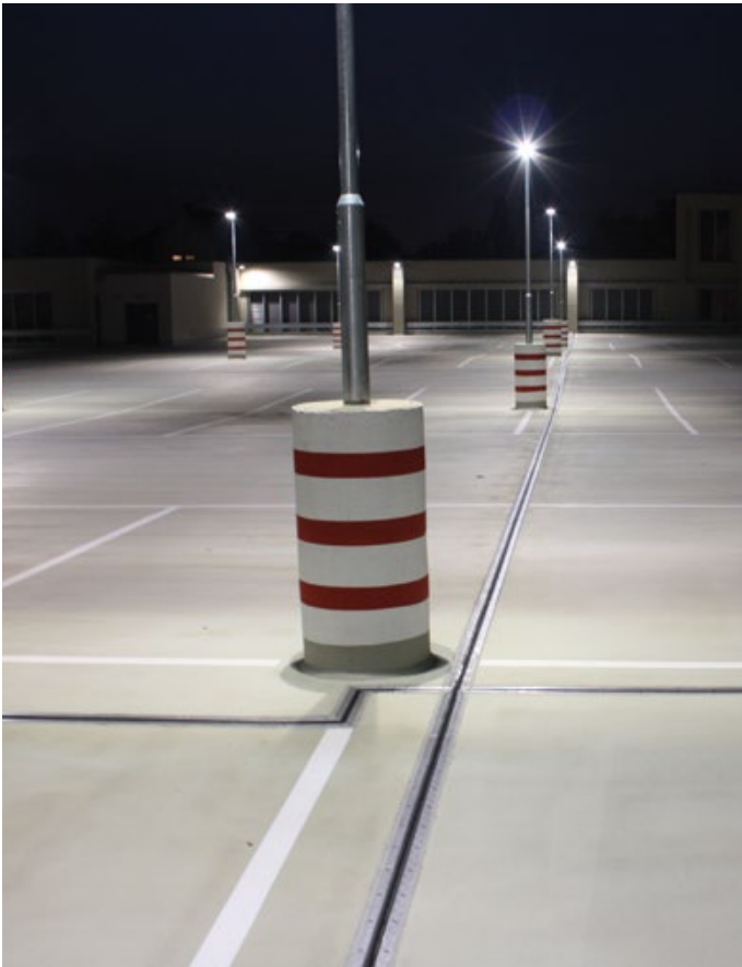
Parkdeck Einkaufszentrum Dresden, Löbtau