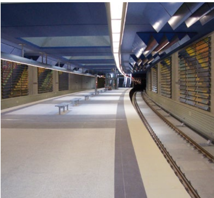
Flughafen Hamburg, U-Bahn