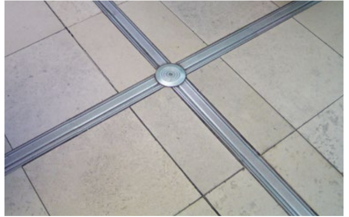
Einkaufszentrum Halle Mitte