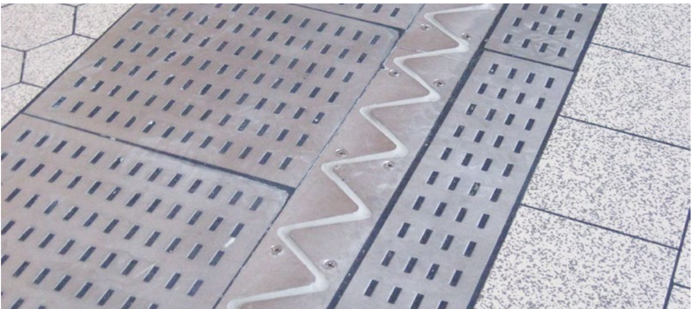
Gewerbeimmobilie Fa. Bionorica, Neumarkt