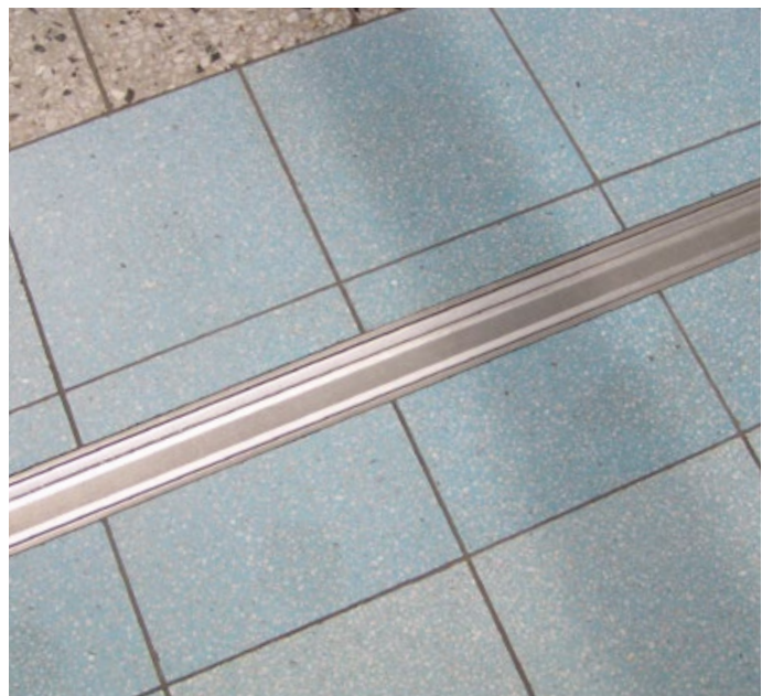
Unfallkrankenhaus Berlin Marzahn