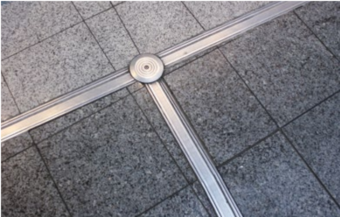
Goethe Galerie, Jena