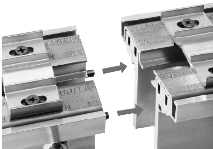
Beispiel FP 90/90 B NI